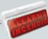
DOUBLE-FACE PANEL PANNEAU BI-FACIAL